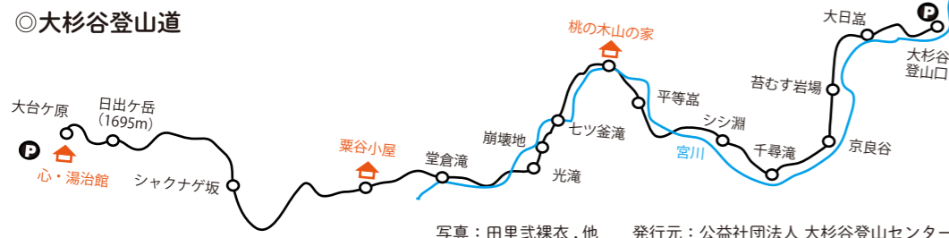
写真：田里式裸衣, 他 発行元：公益社団法人 大杉谷登山センター