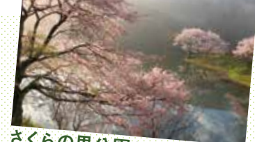
さくらの里公園(本田木屋) おおだいフォトコン応募作品