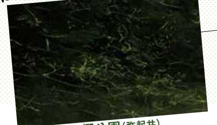
やさい虫の郷公園(弥起井) おおだいフォトコン応募作品