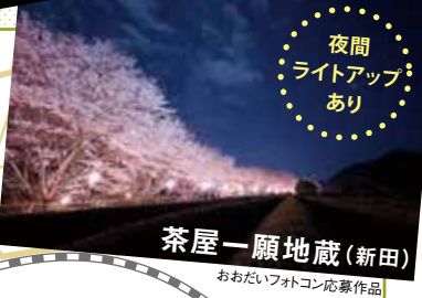
夜間 ライトアップ あり

奥伊勢テラス 大台町の観光情報は 大台町観光協会が運営する 奥伊勢テラスへ 登録有形文化財 トレーディングカードも もらえる!