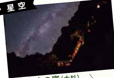
桃の木山の家(大杉) おおだいフォトコン応募作品