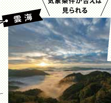
相津峠の雲海(佐原) おおだいフォトコン応募作品