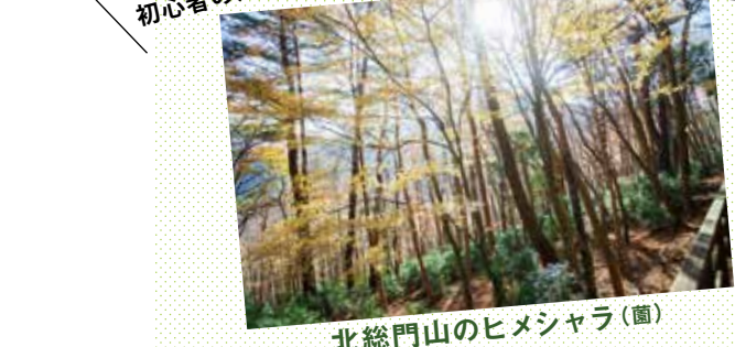
北総門山のヒメシャラ(園)