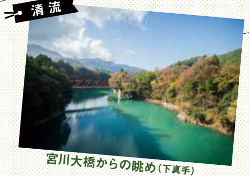
宮川大橋からの眺め(下真手)