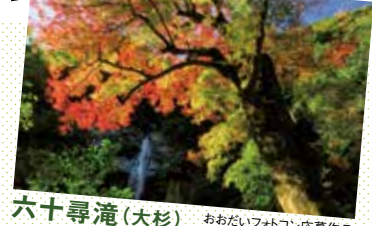
六十尋滝(大杉) おおだいフォトコン応募作品