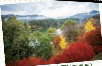
もみじの里公園(下真手)

手つかずの大自然や 日本の原風景ともいえる のどかな里山。 四季折々の景色に 心洗われる!