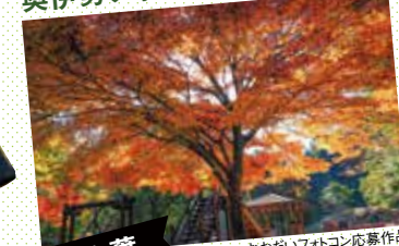
紅葉 おおだいフォトコン応募作品